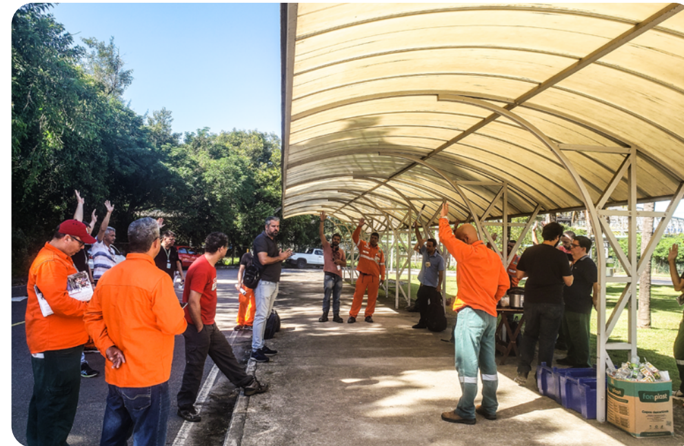
Continuação da Operação Padrão, entrega do sobreaviso, renúncia da brigada e estado de greve também foram aprovados por unanimidade pela categoria

Nesta segunda-feira, dia 8 de maio, seguindo as mobilizações pelo Novo Adicional Transpetro, trabalhadores(as) do TECAM aprovaram continuidade da mobilização pelo Novo Adicional Transpetro, o Estado de greve, operação, entrega do sobreaviso e renúncia coletiva da brigada voluntária. Foi aprovado também referendar a proposta do Novo Adicional elabo-